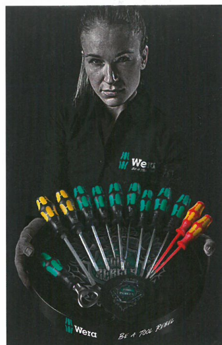
Eine Runde Schraubendreher - die Wera Promotion für den Dreh am Feierabend.

Damit der Spaß auch am Feierabend nicht zu kurz kommt, hat sich Wera eine Promotion ausgedacht, die auch ein schönes Vatertagsgeschenk sein kann: elf „Kraftform plus“-Schraubendreher mit den wichtigsten